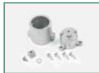
N733036 - MOX Mécanisme de déblocage extérieur pour modèle SIBOX.