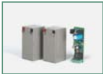
P125008 - VIRGO BAT Batteries de secours et chargeur de batteries (LINX).