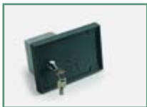
N574005 - SIBOX Boîtier vide pour le déblocage extérieur et clavier de commande. Dimensions 179,5 x 122 x 92 mm.