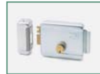
D121017 - ECB SX Serrure électrique horizontale gauche. Les versions droite et verticale sont également disponibles.