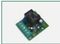
D111761 - ME BT Carte de la serrure électrique 12 Vac, 24 Vac pour opérateur BT.